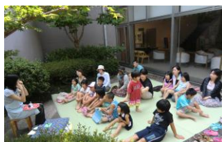
田鶴浜図書館 中庭にて