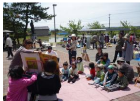
なかじまにぎわいマーケットにて